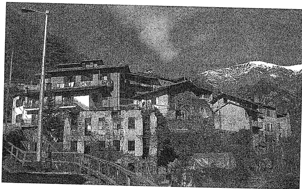
La borgata Pons oggi.