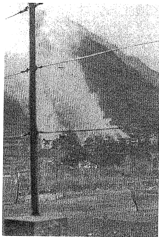
L'incendio della borgata Pons.

«Ci sono solo più io qui che ho vissuto la tragedia dell'incendio. Era il 21 di marzo del 1944, all'una dopo pranzo e ricordo perfettamente che quel giorno... avevamo fatto la polenta per pranzo; c'era già la polenta, allora era una gran cosa, perché di solito non c'era polenta. Avevamo appena finito di mangiare e siamo usciti nell'aia, così, e stavano arrivando i tedeschi, che attraversavano il Chisone, il fiume laggiù e che avevano un fascio di paglia... ce n'erano cinque o sei. Noi siamo rimasti proprio senza capire cosa poteva succedere: "Con 'sto fascio di paglia - dicevamo - ma cosa vogliono fare? Vorranno andare a dormire in qualche baita?" Quando non si sa, non si sa. Poi arrivano, arrivano davanti a casa nostra; prima avevano incendiato la casa di Bertalmio. Poi son venuti da noi: ...ma dei ragazzi da noi non ce n'erano, non avevamo figli, avevamo una sola figlia... Non hanno detto niente; ci hanno soltanto detto: "Raus! Raus!" E poi sono andati nella stalla e ci hanno fatto capire di portare via le bestie, magari non volevano che bruciassero; avevamo una mucca e tre capre. Allora abbiamo slegato 'sta mucca e le capre e dove andavamo? Ci siamo incamminati su per la strada, lì, del Podio, quella strada brutta lì che andava su ai Bout; con le nostre bestie, ci